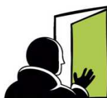
Asbl Sans Logis 135, rue Saint-Laurent 4000 Liège www.sans-logis.be